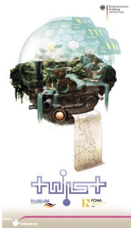
Abb. 2: Simulationsspiel (Serious Game)

tem (PUS) und ein Simulationsspiel („serious game“) zugänglich gemacht (Abbildung 2).