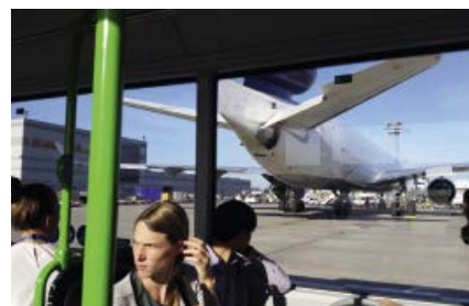
Vorfeldrundfahrt der Jungen DWA am Frankfurter Flughafen