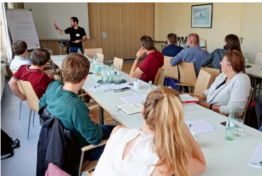
Jahrestreffen der Jungen DWA

Nachfolgend machten wir uns auf den Weg zum Hotel, um von dort aus ge-