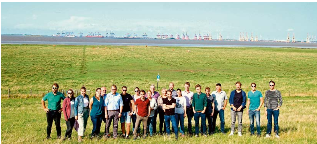
Jahrestreffen der Jungen DWA in den Weiten Norddeutschlands