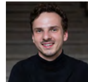
Tobias Orzeszko Kantor Evangelisch-Reformierte Kirche zu Leipzig