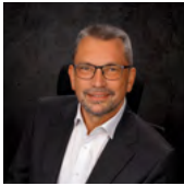
Oberbürgermeister Alexander Baumann Große Kreisstadt Ethingen (Donau)