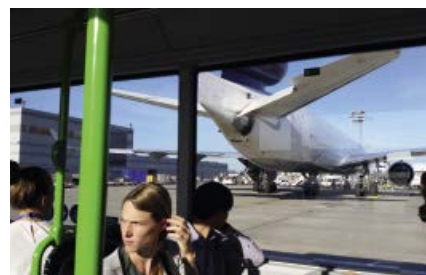
Vorfeldrundfahrt der Jungen DWA am Frankfurter Flughafen