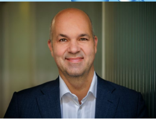
Prof. Marcel Fratzscher

Präsident Deutsches Institut für Wirtschaftsforschung e.V. (DIW Berlin)